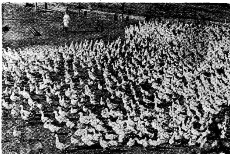
Mažeikių rajono "Ventos" tarybinio ūkio ančių fermoje. Kolūkyje auginama 50,000 paukščių.

Velionį pažinau per 35 metus ir darbe kartu teko išdirbti virš 20 metų. Jis niekuomet nesiskųsdavo savo nesveikata.