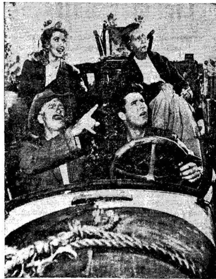
Buddy Ebsen, Max Baer Jr., Donna Douglas ir Irene Ryan, Beverley Hillbilies, kurie juokina televizijos žiūrėtojus kas šeštadienį per Kanados ir JAV televiziją.

TORONTO. — Toronto policija pranešė, kad ant kelių bus sulaikomi ir tikrinami automobiliai, ar jie yra tvarkoj, netu-