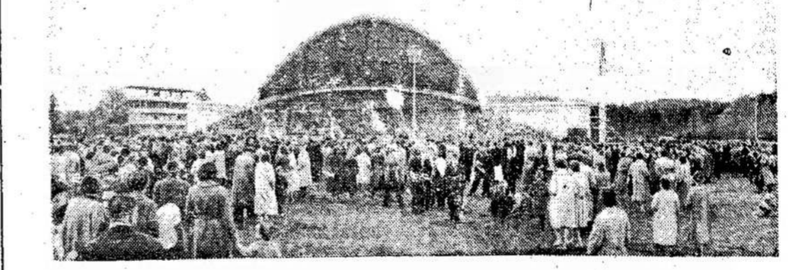
Aplink Vingio parko estradą Vilniuje vasarą šventadieniais visada pilna žmonių. Šią vasarą Vingio parkas susilauks rekordinio svečių skaičiaus. Čia suvažiuos jubiliejinės respublikinės dainų šventės dalyviai ir daugybė turistų iš artimų ir tolimų šalių.