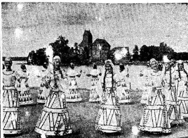
Lietuvos valstybinis dainų ir šokių ansamblis koncertuoja prie Trakų pilies. Šis ansamblis dabar vadinasi "Lietuva".