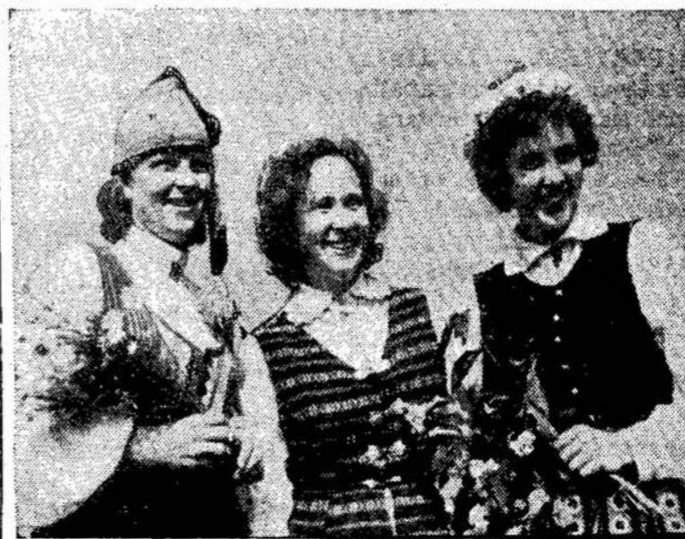
Zarasuose vykusios šventės metu susitiko estaitė, lietuvaitė ir latvaitė.

JAKARTA. — Indonezija atidarys Meksikoje savo biznio ofisą, o tuo patim tarp uždarys Jungtinėse Valstijose.