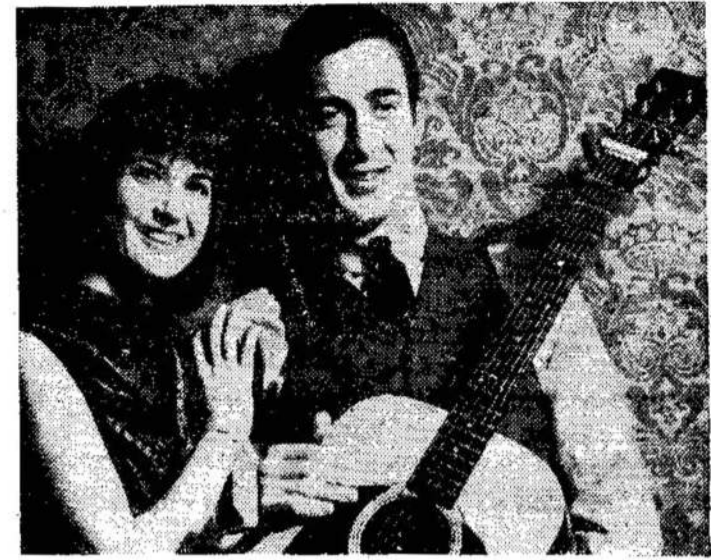
Kanados pasauliniai pagarsėję liaudies dainų dainininkai, Ian ir Sylvia Tysonai. Jie dažnai matomi ant televizijos Kanadoj ir Jungtinėse Valstijose.

Kaip matome, LLD Centro Komitetas atliks didelius darbus atžymėjimui organizacijos jubiliejaus. Nariams taip pat reikia parodyti daugiau akty-