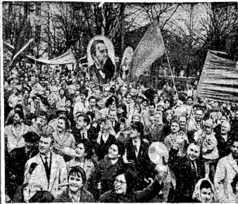
Gegužės Pirmosios darbo žmonių šventinė demonstracija Vilniuje.