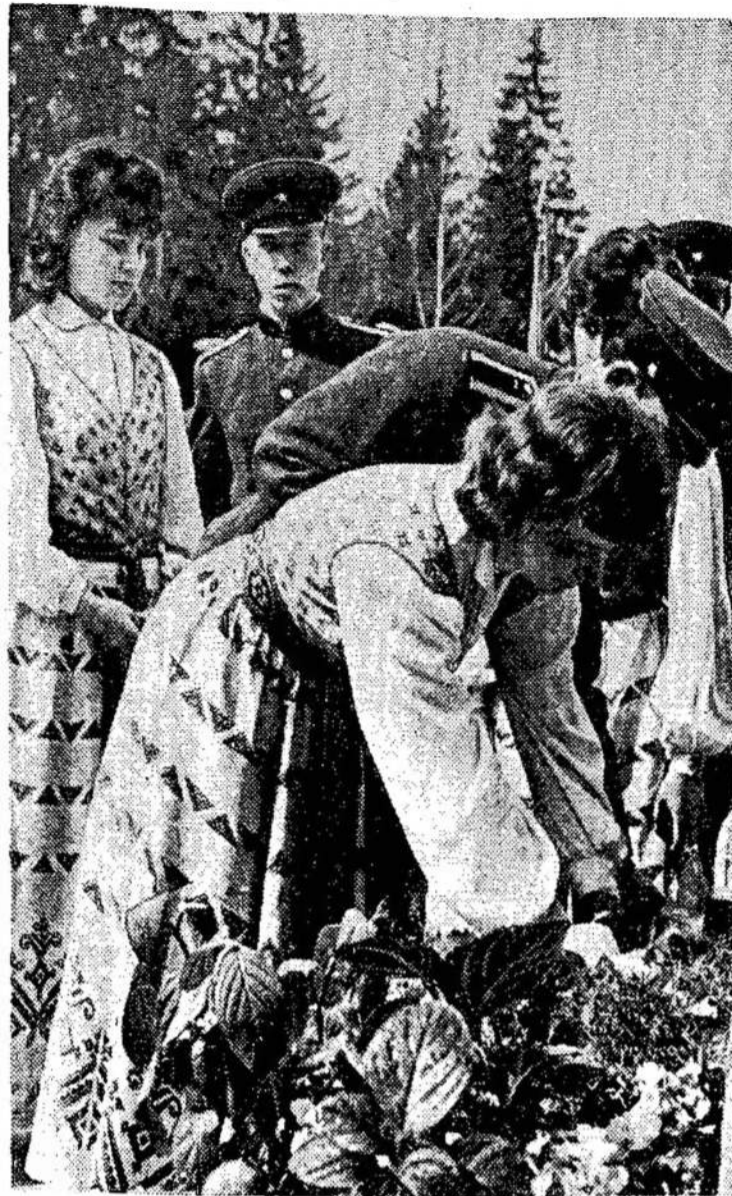
Gegužės 9 dieną tūkstančiai vilniečių padėjo gėles ir vaikus Karių kapinėse.

Nuotraukoje: padedamos gėlės ant kritusių kovotojų kapų.