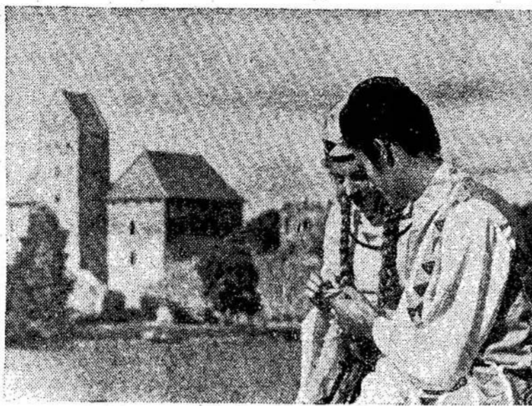
Senoji Trakų pilis ir... dvi jaunos širdys