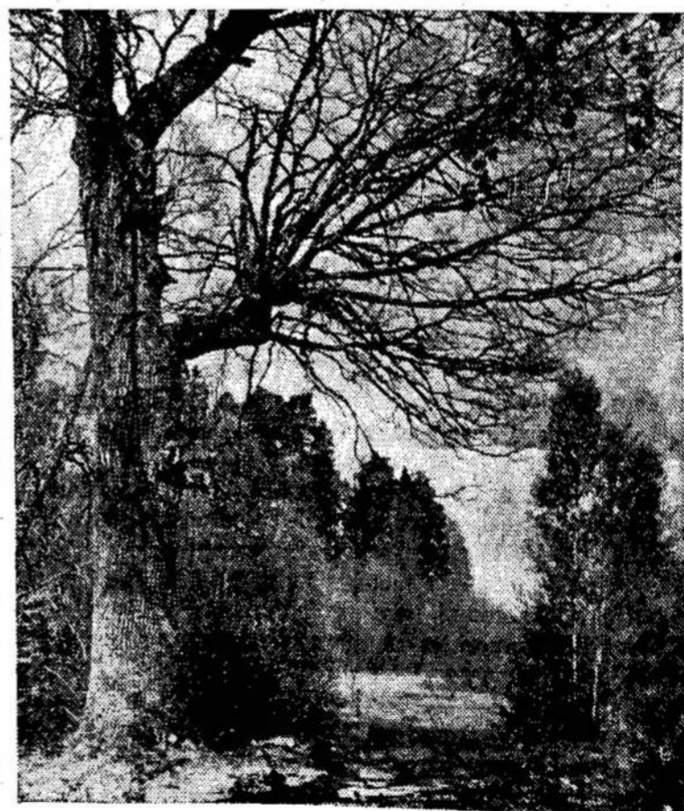
Punios šilas — ramybės karalystė

PANAMA. — Panamos valstiečių bežemių metinės pajamos sudaro vos $40.00.