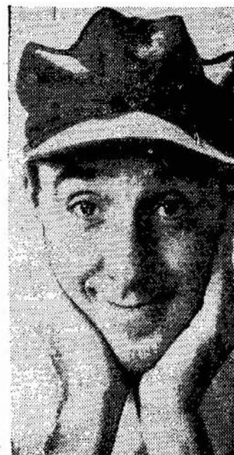
Jim Nobars, Alabamoj gimęs aktorius, kurs vaidina Gomer Pyle rolę komedijoje ant televizijos.

Vis aštriau gėlo vandens stoką pajunta ir Baltijos jūros šalyse, jų tarpe ir Lietuva. Tarybų Sąjungos ir Lenkijos mokslininkai pateikė keletą projektų, kurie siūlo vienokiu ar kitokiu būdu Baltijos jūrą paversti gėlo vandens ežeru. Tuo tikslu siūloma sąsiauriuose pastatyti lengvas užtvankas, kurios neleistų pritekėti sūriam vandeniui iš Atlanto į Baltiją.