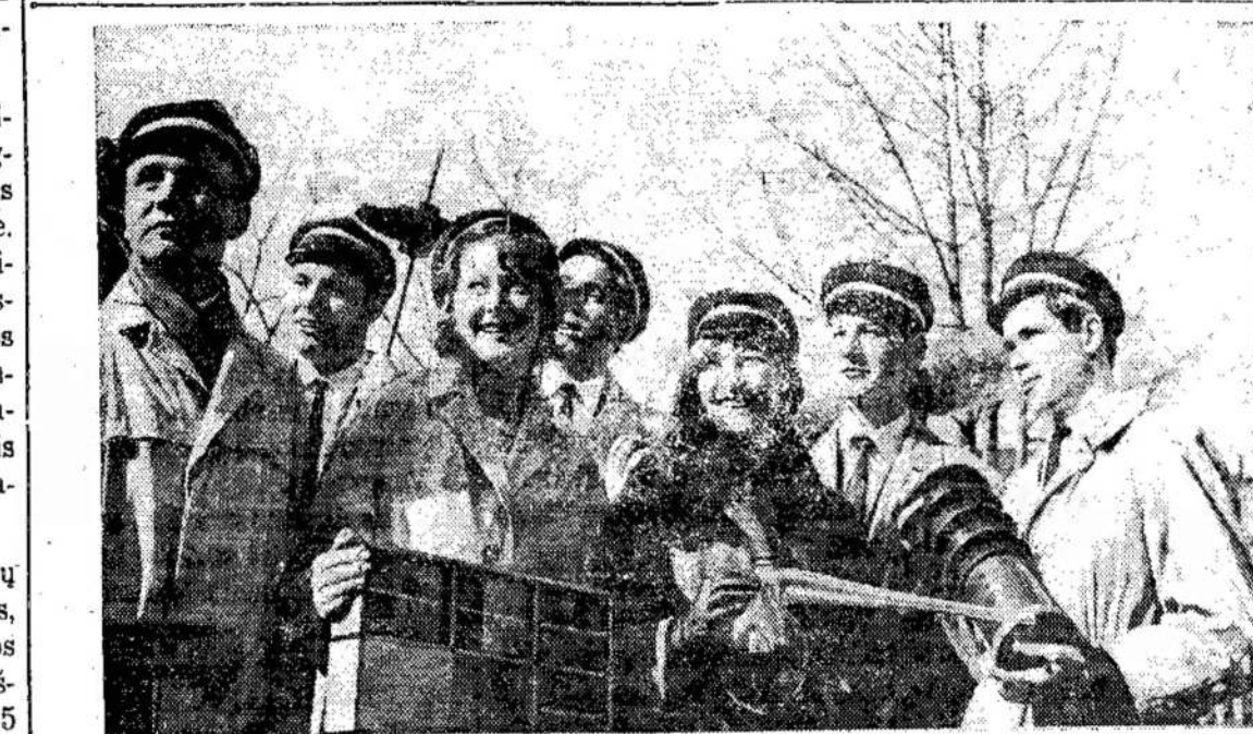
Šių metų vasarą Tarybų Lietuva mini savo 25-metį. Pukią dovaną šventei ruošia studentų miestas — Kaunas. Vien tik šiemet miesto aukštosios mokyklos išleis specialistų trigubai daugiau, negu buržuazinė Lietuva buvo išleidusi per 20 metų. Nuotraukoje: štai jie — būsimieji 55 specialybių inžinieriai, kuriuos ruošia Kauno Politechnikos institutas.

Buržuazija šūkavo apie inteligentų perteklių Lietuvoje. "Inteligentai bedarbiai — gyvenimo palaužti žmonės... [Kauno savivaldybės socialinį skyrių kreipėsi 247 inteligentai, prašydami parūpinti jiems darbo" — taip rašė 1940 m. pradžioje fašistinės vyriausybės oficiozas. T dėl vyriausybės stengėsi apriboti ir taip menkas mokymosi galimybes.