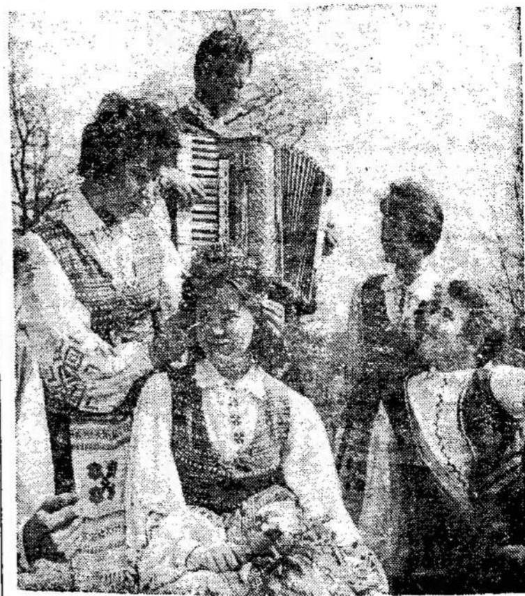
Kauno aukštųjų mokyklų studentų grupė miesto apylinkėse.