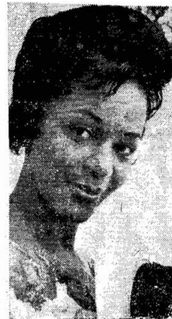
Kanados radio dainininkė Eleanor Collins.