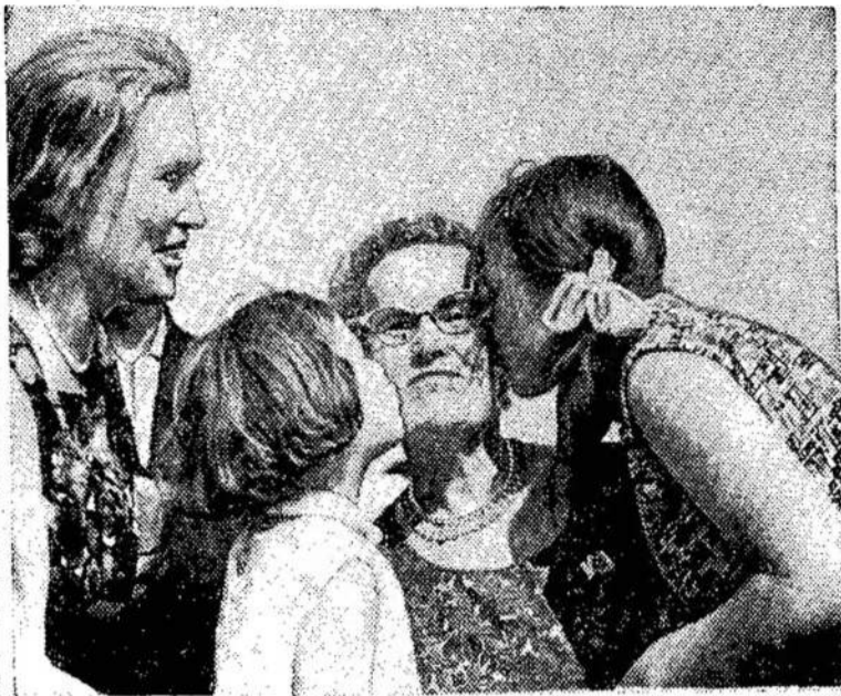
A. Bojelenę sveikina Vilniaus aerouoste atvykę giminės. Tokių scenų buvo labai daug atvykstant turistams iš Jungtinių Valstijų, Kanados ir kitur.

Jie beveik visi tokie pat politikieriai! Jei norėtų, ir dabar