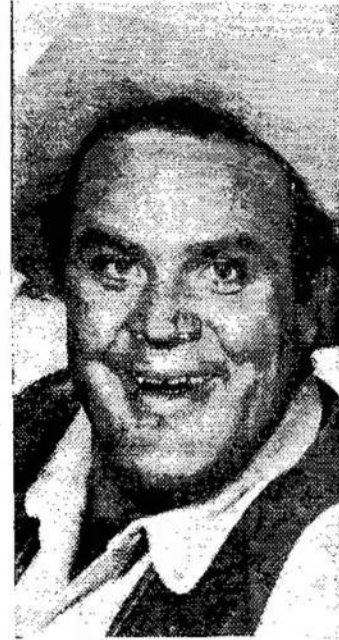
Dan Blocker, vienas iš televizijos pastatymų "Bonanza" aktorių. Jis vaidina Hoss Cartwright vaidmenį.