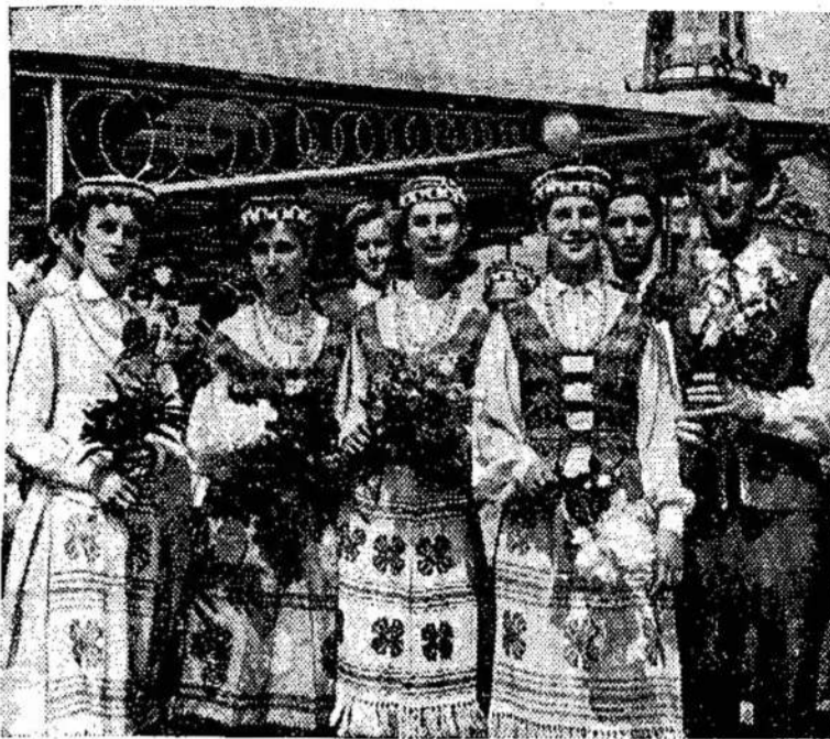
Vilniaus merginos ir jaunuoliai su gėlių puokštėmis sutinka brangius svečius — JAV lietuvius, atvykusius į tėvų žemę.