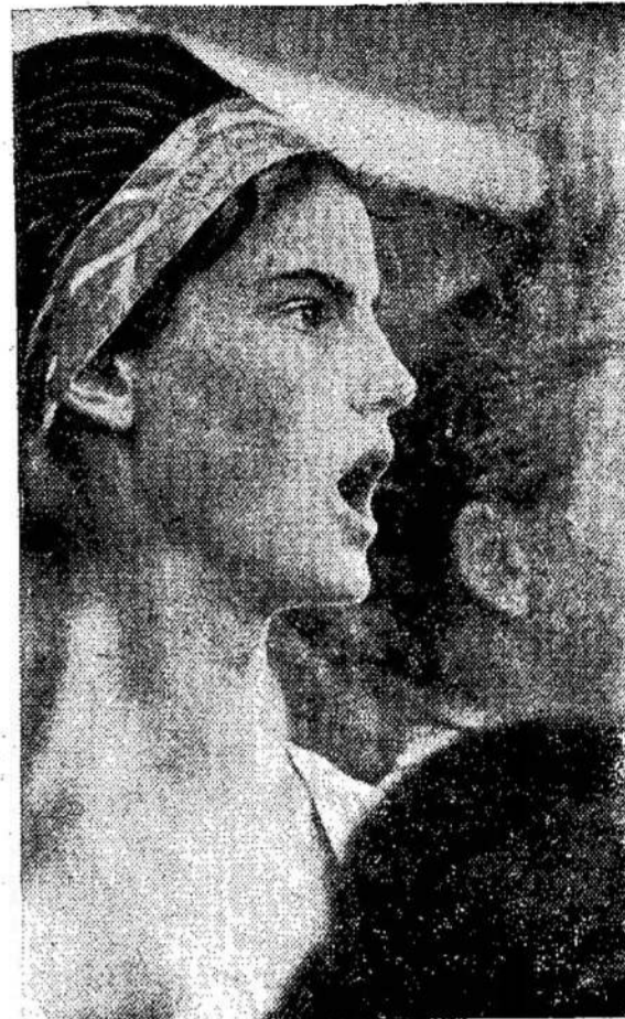
Viena iš 20,000 dainininkų, kurie dainavo Vilniuje per dainų šventę ryšium su LTSR 25 metų sukaktuvėmis.

Pakistanas kreipėsi į SEATO, kad padėtų gintis nuo Indijos, bet Britanija, to bloko šerdis, atsiskyrė padėti Pakistanui. Jungtinės Valstijos sakoma sulaukė pagalbą ir vienai ir kitai. Štai jums ir nauda iš bloko.