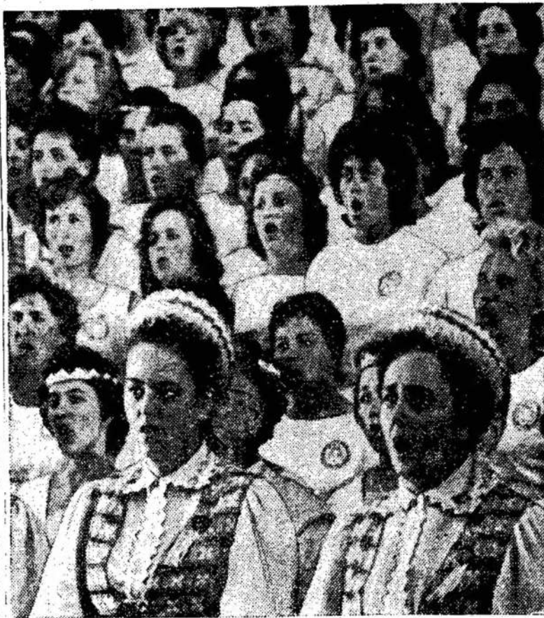
Kai JAV dainininkai dainavo Vingio parke Vilniuje kartu su daugiataktantiniu choru.

Visuomenės interesų atžvilgiu, gal geriau būtų, kad šiame parlamente nebūtų nei vienos partijos daugumos. Geriau būtų, kad vietoj socialkreditorių, kreditoristų būtų nauji demokratai. Liberalams niekad nebus problemos praveisti gerus tarimus, jeigu naujieji demokratai bus tvirtesni. Thompsono (socialkreditorių lyderis) ir Diefenbakerio (konservatų) partijos turėtų būti sumažintos. Praėjusiam parlamente tos partijos vaidino reikiamą vaidmenį.