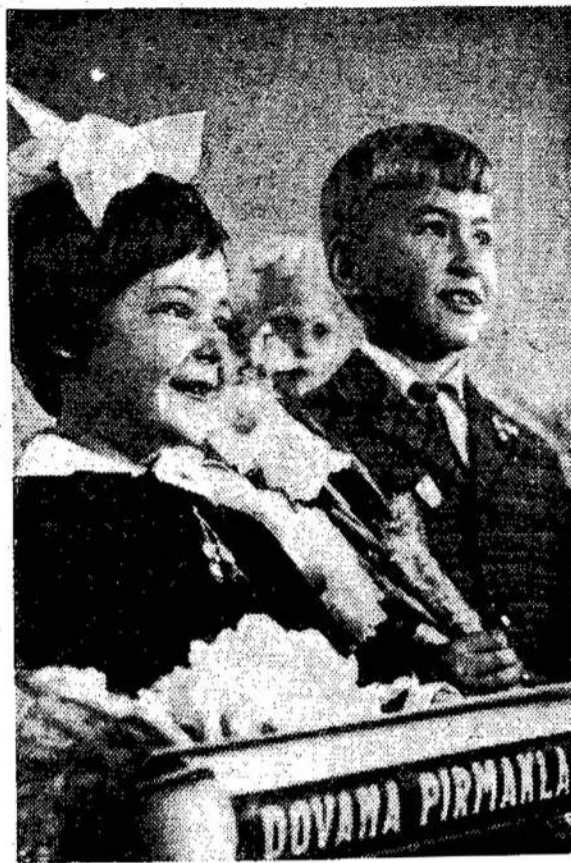
Iškilmingai palydėjo į mokyklą grupę savo auklėtinių Šiau- lių 16-jo vaikų darželio kolektyvas.

Klubas savais pinigais sta- tybos užbaigti negalės. Yra rei- kalinga paskola. Klubu visuoti- no susirinkimo nutarimu, pas- skola pirmojo morgičio — $150,000 — renkama iš savo narių. Gali būti ir ne narys, bi- le tik lietuvis. Ir mokėti 7%. Atidarymo proga sekmadienį, nariai per vieną dieną sudėjo $54,000. Ir virš $50,000 jau da- vė pasižadėjimus. Atkreipia- mas dėmesys į klubo narius ir