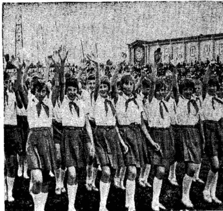
Patys jaunieji dainininkai Dainų šventėj Vilniuje per 25 metų sukaktuves.

Jis taip negarbingai buvo pašalintas iš Katangos, kai jis atliko savo pareigas dėl užsienio kompanijų tenai.