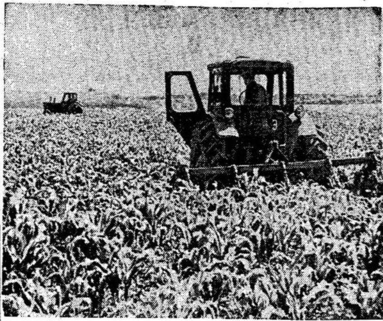
Kukurūzų lauke Lietuvoje

Kada visas pasaulis pakrypo už taikų tautų ir valstybių gyvenimą, už kultūrinį bendradarbiavimą, — mūsų "vaduotojai" siekia kiršinimo, neapykantos sklaidimo, — karo.