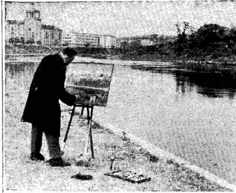
Reikia nupaišyti Neris krantinę Vilniuje

du kontinentus, skirtas tiesiamam geležinkeliui Gurjevas-Astarachanė. Ši 330 km ilgio plieninė magistralė beveik tūkstančių kilometrų sutrumpins kelią iš Vidurinės Azijos arba Kazachstano į Tarybų Sąjungos pietines europines sritis.