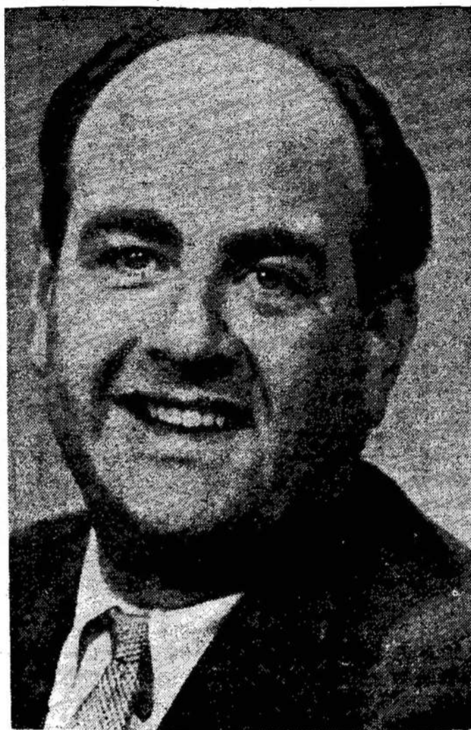
Kanadietis aktorius Larry Mann, kuris dabar dalyvauja gaminiame filmų Hollywoode, JAV.