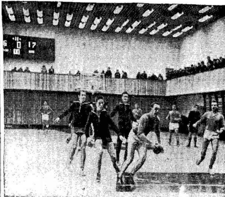
Rankinio varžybos naujoje Vilniaus statybininkų kultūros rūmų salėje.

"Calutiname analize, nėra didelio skirtumo tarp to, už ką aš stoviu, ir to, už ką stovi National Association of Manufacturers. Aš stoviu už pelno stemą. Aš manau, kad tai puikus akstinas. Aš pilniausiai tikiu į laisvojo verslo sistemą".