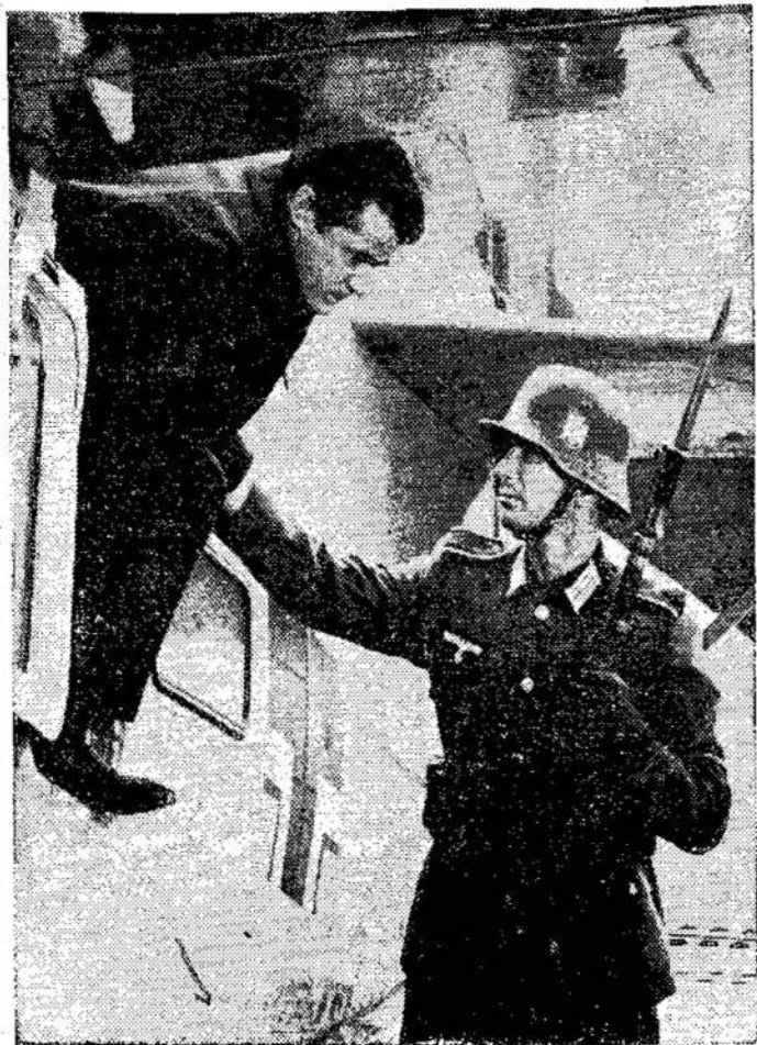
Robert Goulet (kairė), kurs vaidina amerikietį šnipą David March televizijos pastatyme Blue Light iš Antrojo Pasaulinio karo. Pastatymas eina tęsiniais ir matomas trečiadieniais.