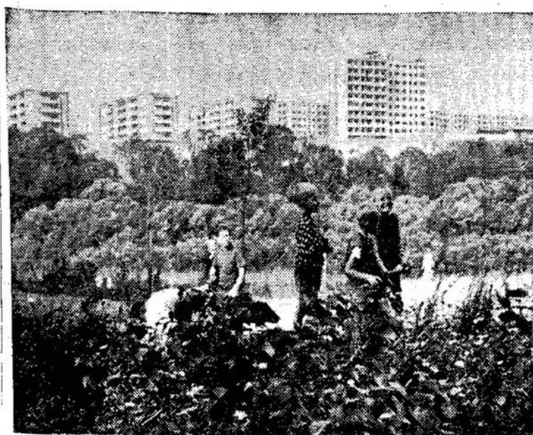
Naujasis Vilnius vasaros metu

Kodėl Konfederacija nori pavilyti Kongreso unijas? Iš vienos pusės, juo daugiau darbininkų prigulės prie Konfederacijos, tuo bus geriau Konfederacijai. Ji bus tvirtesnė. Prie to, kaip jau žinome, Kvebeko provincijoje auga nacionalizmas.