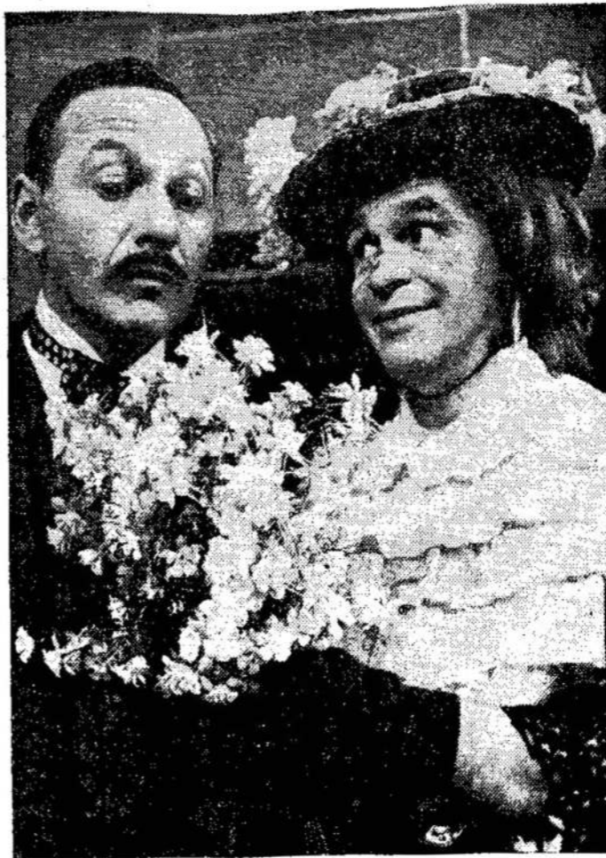
Frank Shuster ir Johnny Wayne, žymieji Kanados komikai. Šioj nuotraukoj jie matomi tokiais, kokiais jie buvo televizijos perstatyme.

Dažnai atsitinka taip, kad žmonės nori išlaikyti kokią nors senieną. Anais metais moters demonstravo, kai buvo užsimota pašalinti iš vidurio gatvės seną medį. Tokių atsitikimų būna labai daug. Kiti nenori apleisti senų lūšnų sentimentaliais išskaičiavimais.