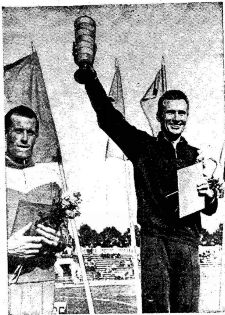
Kęstutis Orentas — daugkartinis TSRS lengvosios atletikos pirmenybių prizinininkas. Pernai užėmęs III vietą penkių tūkstančių metrų bėgime.

Jie laukė teismo už tai, kad pas juos rasta narkotiko (heroin) už $120,000.