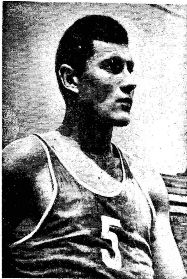
Modestas Paulauskas — TSRS krepšinio rinktinės narys, 1965 metų Europos čempionas.

CBC yra valdiška korporacija, kasmet gaunanti iš vyriausybės $110,000,000, taksais iš žmonių surinktu.