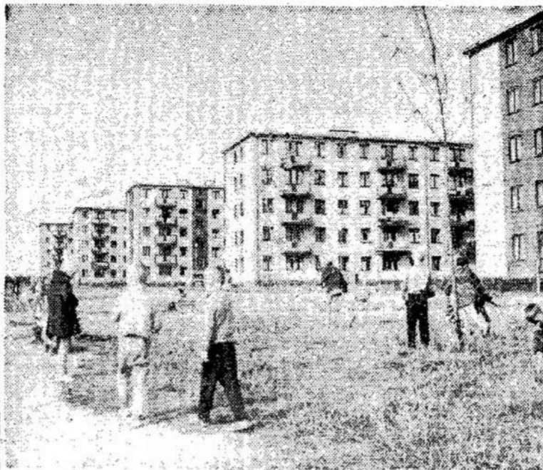
Naujų gyvenamųjų namų kvartale Baršausko gatvėje Kaune.

Jaunoji savo laiku yra dalyvavusi Liaudies Balso vajuje ir buvo Liaudies Balso pikniko žvaigždė.