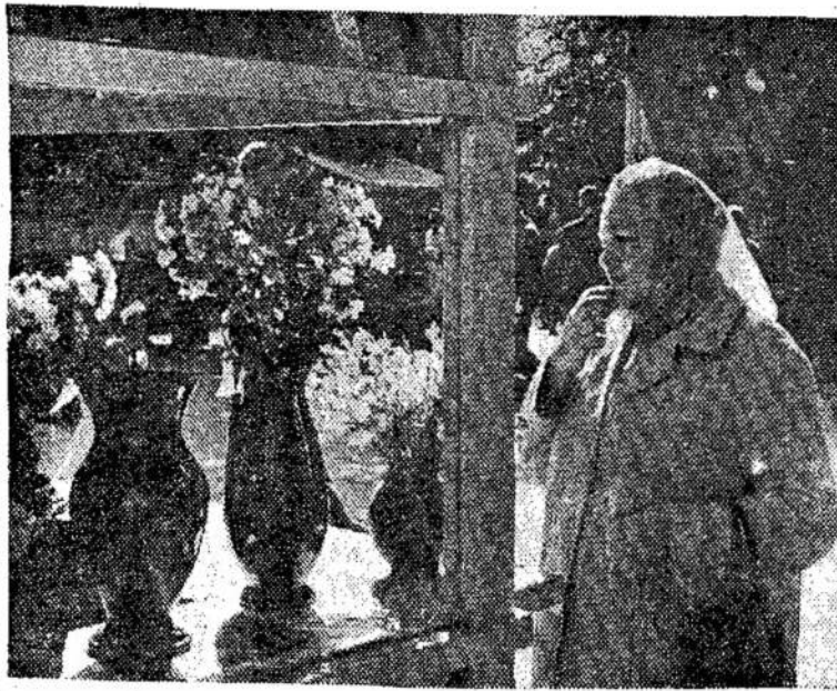
Gėlės reikalingos visiems