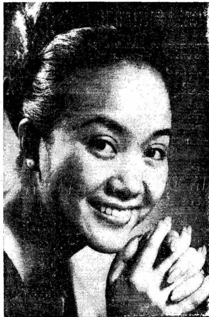
Adrienne Poy Clarkson, viena iš Kanados televizijos programos Take 30 vedėjų. Ji kilusi iš Hong Kongo.

(Ištraukos iš skelbimo, tilpusio Ave Maria, JAV katalikų savaitraštyje, po kuriuo pasirašė šimtai katalikų mokytojų, rašytojų ir spoksmonių, gruodžio 18, 1965 metais.)