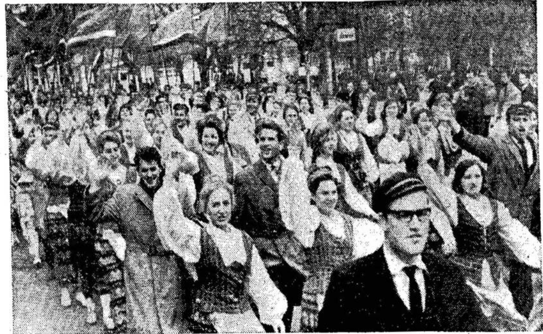
žygiuoja Lietuvos studentija

— Ko man bijoti? Jūs tokia (Pabaiga ant 8 pusl.)