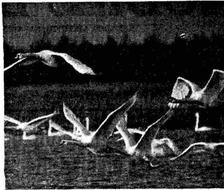
Lėkite baltosios gulbės...