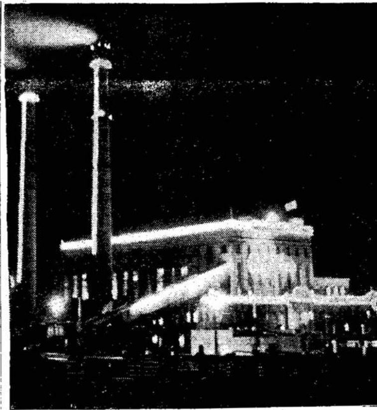
Pramoninė Lietuva naktį

Daugelis amerikiečių pradeda baugintis Kinijos nuklynė ginklų. Nepraėjus keli metai ir Kinija turės taip pat daug nuklynė bombų.