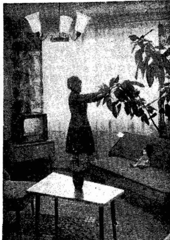
Vilnietė tvarko savo butą