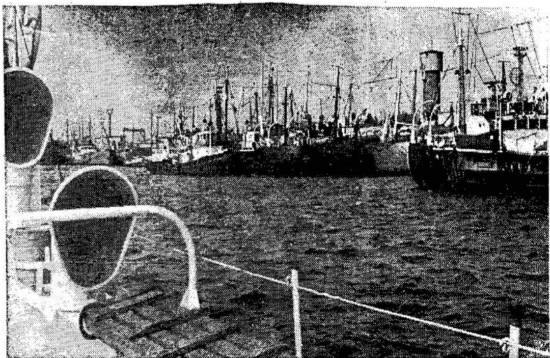
Klaipėdos žvejų uoste