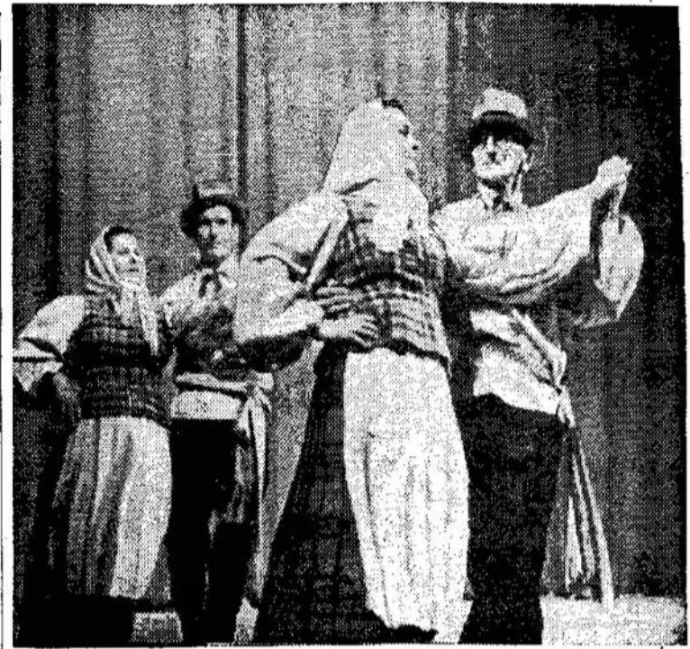
"Šokim, trypkim, linksmi būkim"

Už 50 centų pirkėjas galėjo laimėti automobilį ar $2,000.