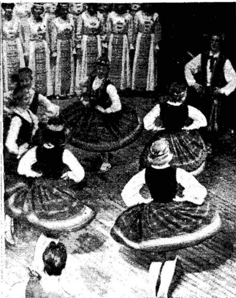
Vilniaus profesinių sąjungų kultūros namuose

Kiek matyti iš visko, tai yra kaip tik priešingai. Ji pasiuntė tenai jau virš ketvirtadaly milijono kareivių. Tenai sutrauktas didelis būrys karo laivų. Orlaiviai bombarduoja Vietnamus ne tik nuo orlaivų.