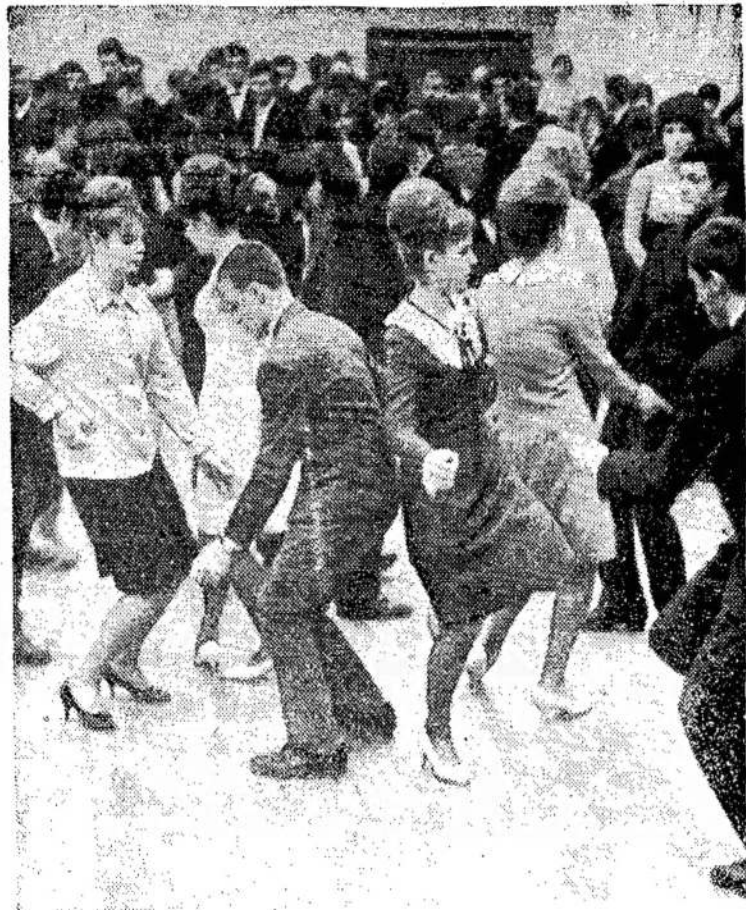
Šokių vakaras Vilniaus profesinių sąjungų kultūros rūmuose.

TORONTO. — Žulikai išsinešė iš Toronto bankų $100,000 pakišdami jiems falsifikuotus čekius.