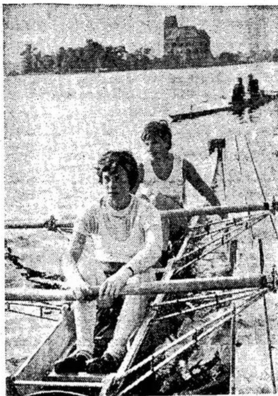
Kas gali būti puikšnio, kaip pasivažinėjimas valtimi Gulbės ežere.

Atsižvelgiant į šių kultūros barų reikšmę žmogaus gyvenime, Tarybų Sąjungoje gegu-