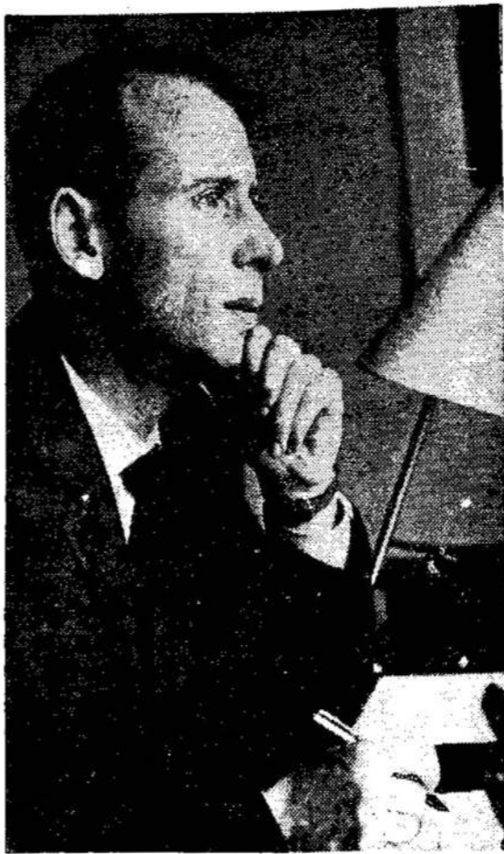
Kandidatas Lenino premijai gauti rašytojas M. Sluckis.