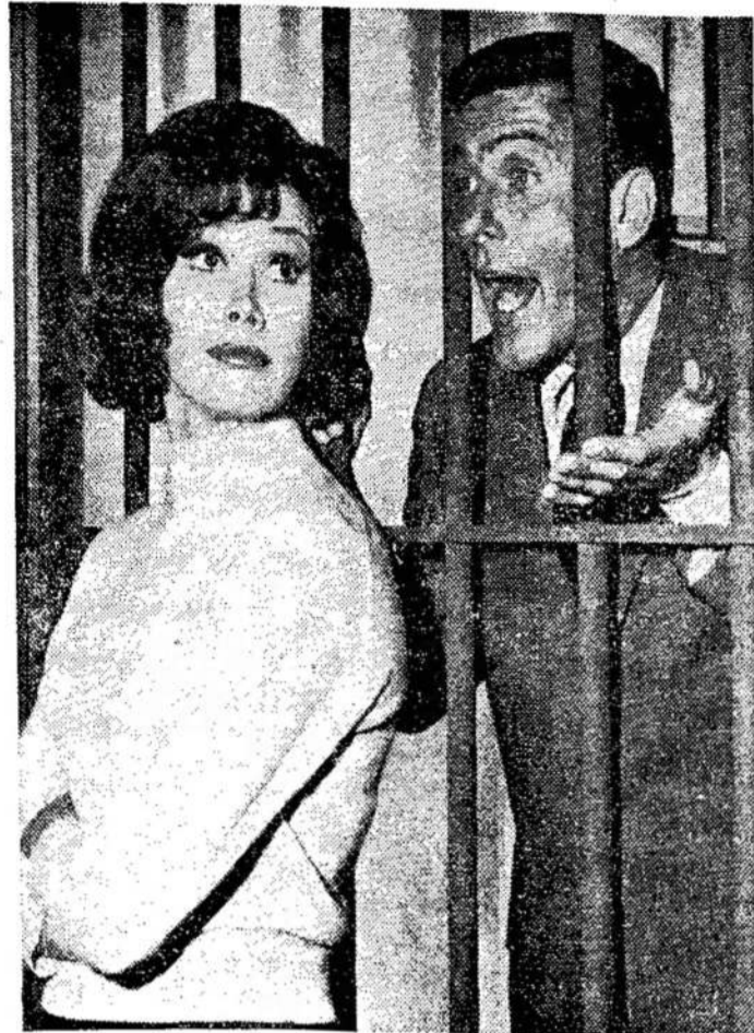
Mary Tyler Moore ir Dick Van Dyke, vyriausi Dick Van Dyke programos aktoriai, vaidina vyrą ir žmoną. Šioj nuotraukoj jis aiškina "žmonai", kad jis nekaltai pakliuvo už grotų.

PARYŽIUS. — Francijos, Italijos, Vokietijos, Britanijos, Japonijos ir kitų vakarinių ša- lių biznierių lenktyniuodami- si ieško rinkų socialistinėse ša- lyse.