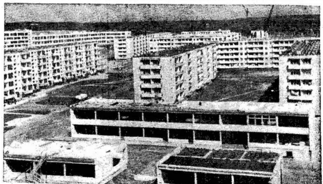
Vilnius auga nesulaikomai. Nauji gyvenamieji namai.