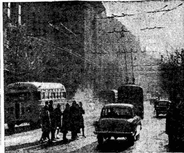
Kapsuko gatvė Vilniuje.