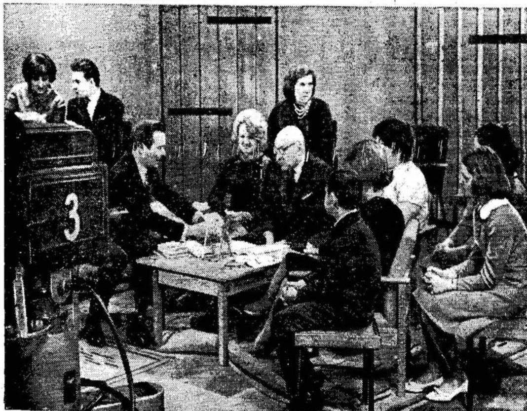
Vakaras televizijos studijoje

Tuo tarpu vis didėja pačių darbiečių eilėse reikalavimas, kad Britanija ištrauktų savo ginkluotą jėgą iš tų šalių, kurios randasi į rytus nuo Suez kanalo.