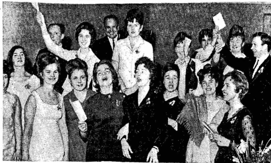
Vilniaus universiteto išleisti nauji gydytojai.

Jis kaltinamas nunešus jo įsteigtos kompanijos — Racan Photo-Copy Corp. Ltd. — virš $400,000. Kompanija subankrutavo.