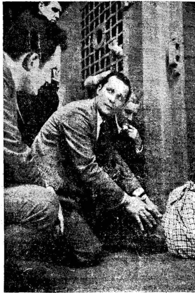
Scena iš naujo Kanados televizijos pastatymo, kuriame vaidina John Vernon.

Nuostoliai siekia virš pusės milijono dolerių.