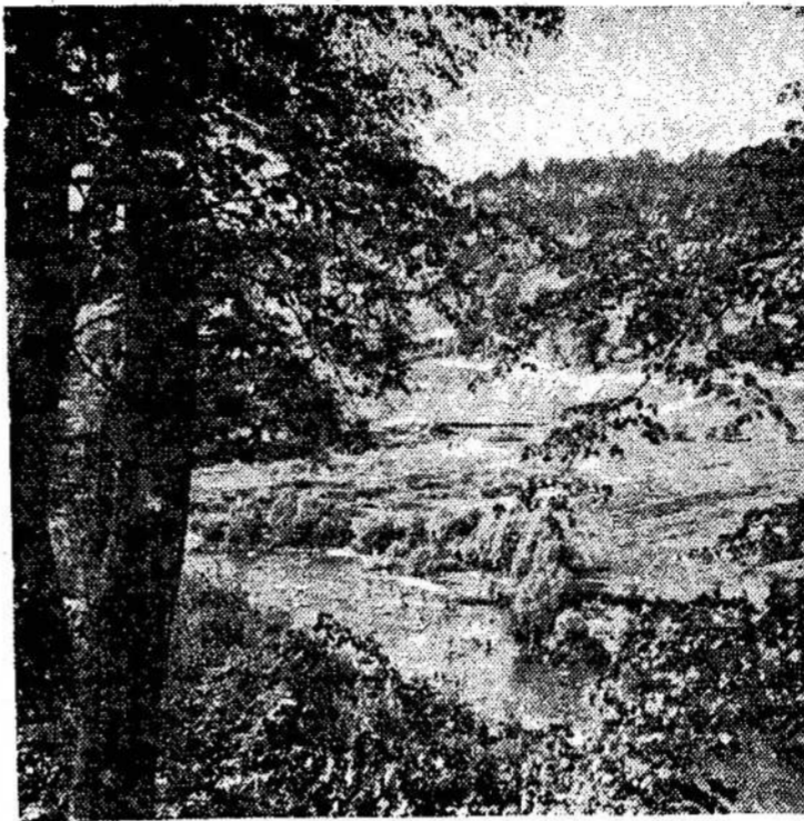
Tylus vakaras Žuvinto rezervate