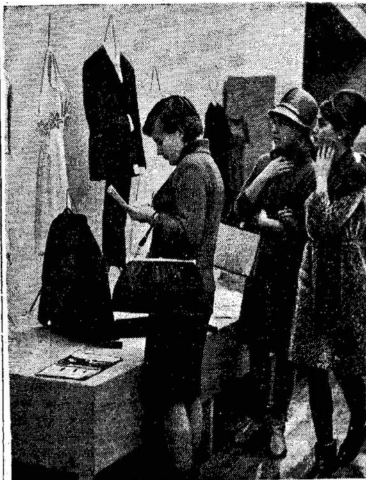
Kuri suknelė gražiausia, madingiausia? Momentas iš respublikinės drabužių parodos.

Keturiasdešimt trys procentai sako, kad JAV yra vyriausias kaltininkas už karą Vietname.