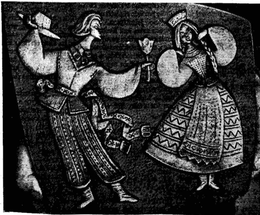
K. Tulienės darbas metale "Pasveikinimas"

Dienraštis Tris kart Du kart Savaitrai DVISAV Mėnesini LAS IR GYV Laikrašč Priimam kame persiun nadiškais paš Taipgi p virš vardinų Metinių — $4.00; "Li — $2.00; "G $3.00; "Tary Pusmeti kaip gegužio Užsaky Liaudies Ba