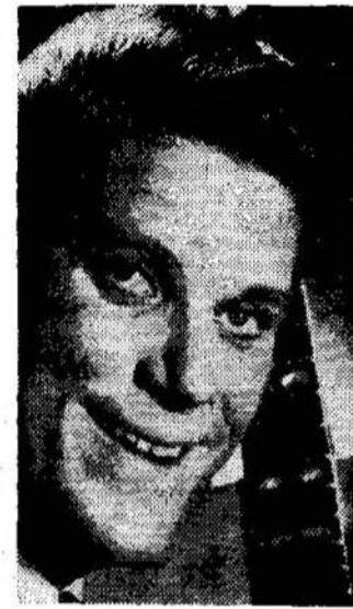
Tommy Hunter, Kanados televizijos dainininkas.