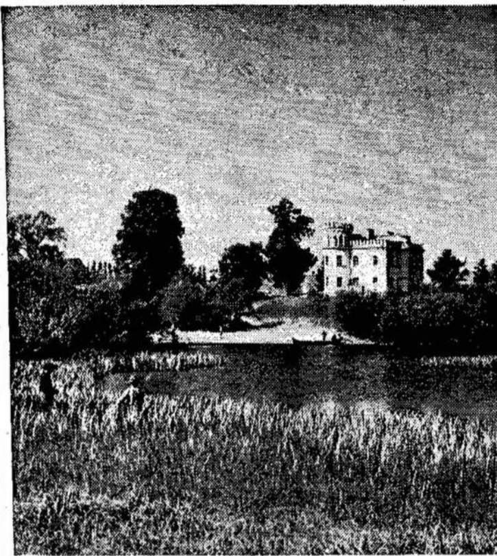
Nevėžis ties Kočiuniškėm

Oshawoje General Motors dirbtuvėse auga didelis darbininkų nepasitenkinimas. Mat kompanija, sumažinusi darbininkų skaičių 2,600, nori tiek pat darbo padaryti su likusiais. Jie žino,