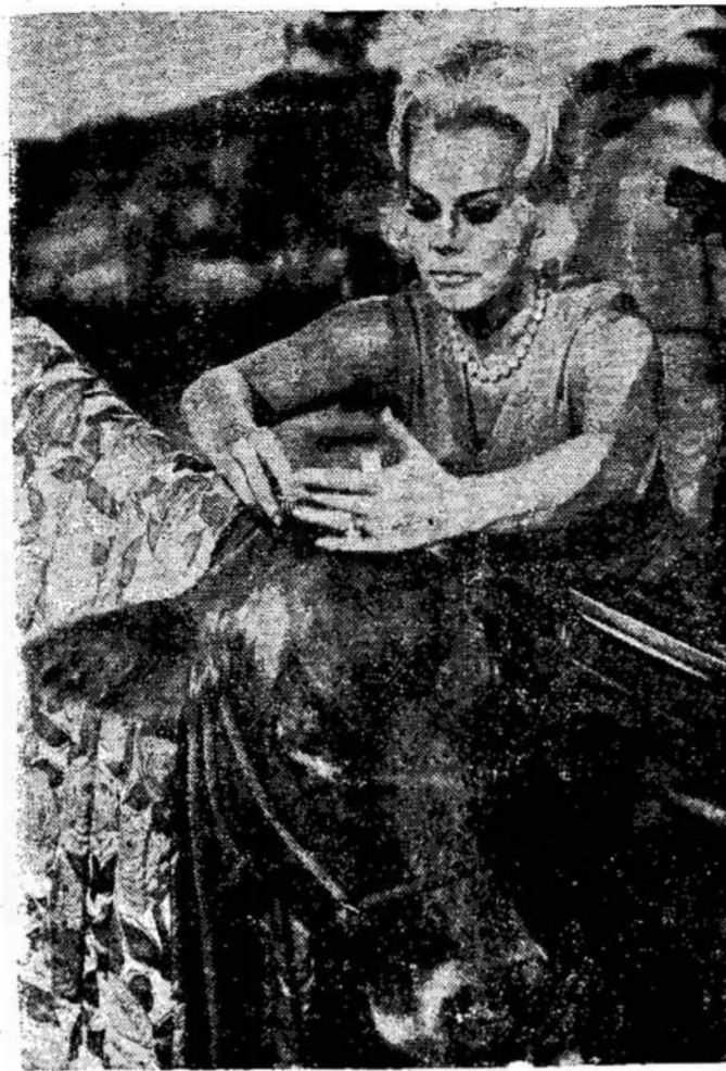
"Green Acres" (Žalieji Akeriai) programos žvaigždė Eva Gabor. Programa ant televizijos matoma trečiadieniais.