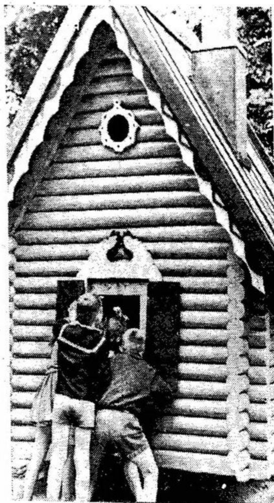
Vilniaus Gedimino aikštėje prie pasakų namelio

Charlottetown. — Prince Edward Island vyriausybė per savo agentūrą, Fisherman's Loan Board, perėmė Bathurst Marine Ltd. ir operuos šią laivų statybos kompaniją per Ferguson Industries Ltd.