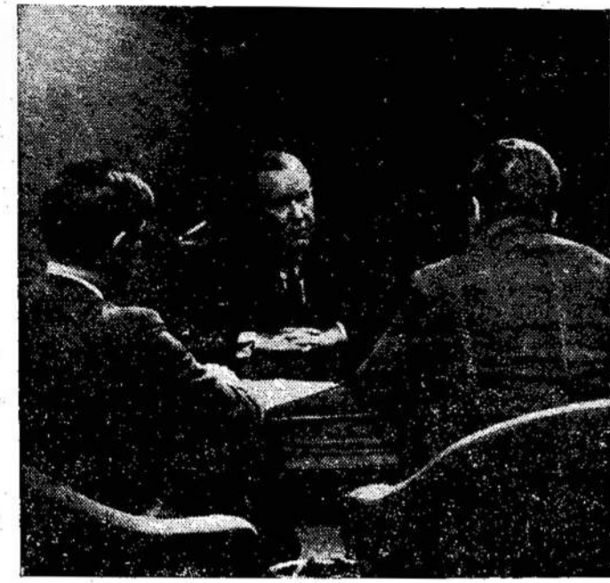
Kanados premjeras L. B. Pearson (vidury) atsakinėjo į reporterių klausimus įvairiais reikalais per televiziją.

Yra daug tiesės jų teigime. Ir dar galima dadėti prie to vis-