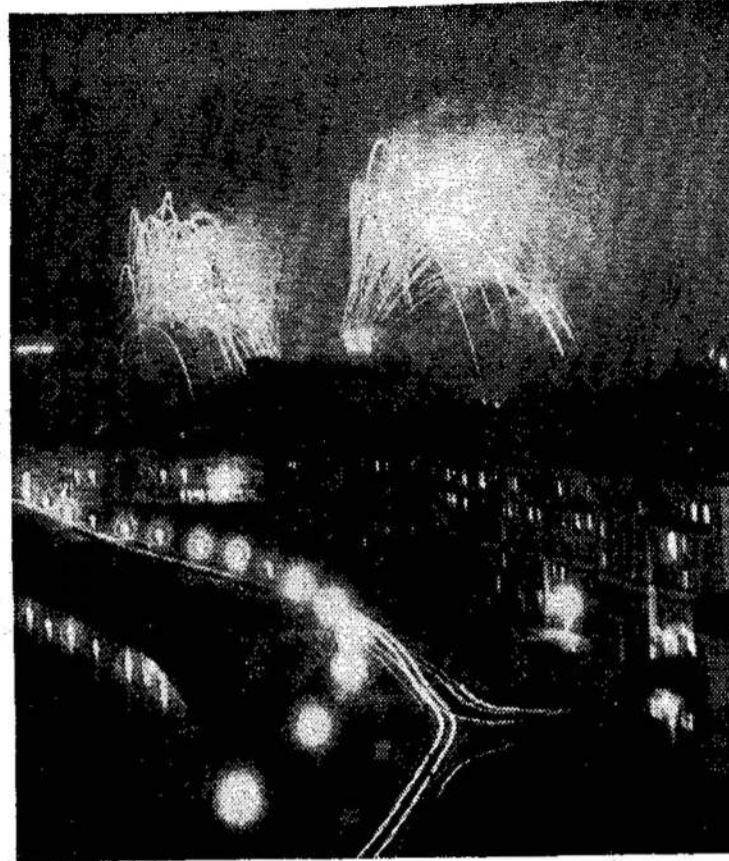
Šventinis salutas Vilniuje

Visai nestebėtina, kad daugelis Kanadoje yra netekę vilties. Girdi, ar anksčiau ar vėliau, vistiek Kanada bus Jungtinių Amerikos Valstijų valstija.