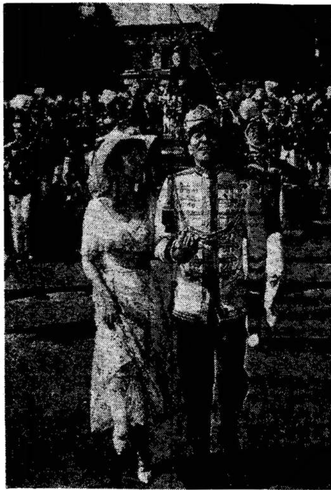
Scena iš trijų valandų pastatymo ant televizijos praėjusį antradienį. Priešakyje orkestro konduktorius prof. Harold Hill (vaidino Robert Preston) ir Marian, knygyno vedėja (vaidino Shirley Jones.)

Būtų visai beerikalingas laiko eikvojimas, jeigu būtų ban-