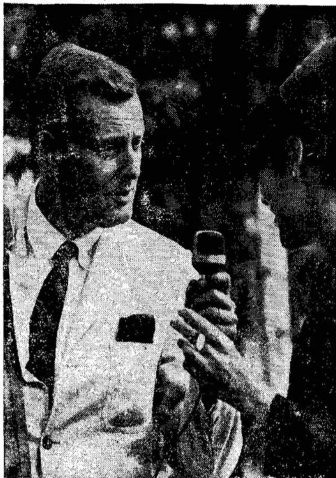
Televizijos žurnalistas Warner Troyer, CBC-TV programos "The Public Eye" vedėjas. Minimoj programoj ieškoma visuomenės opinijos įvairiais klausimais.