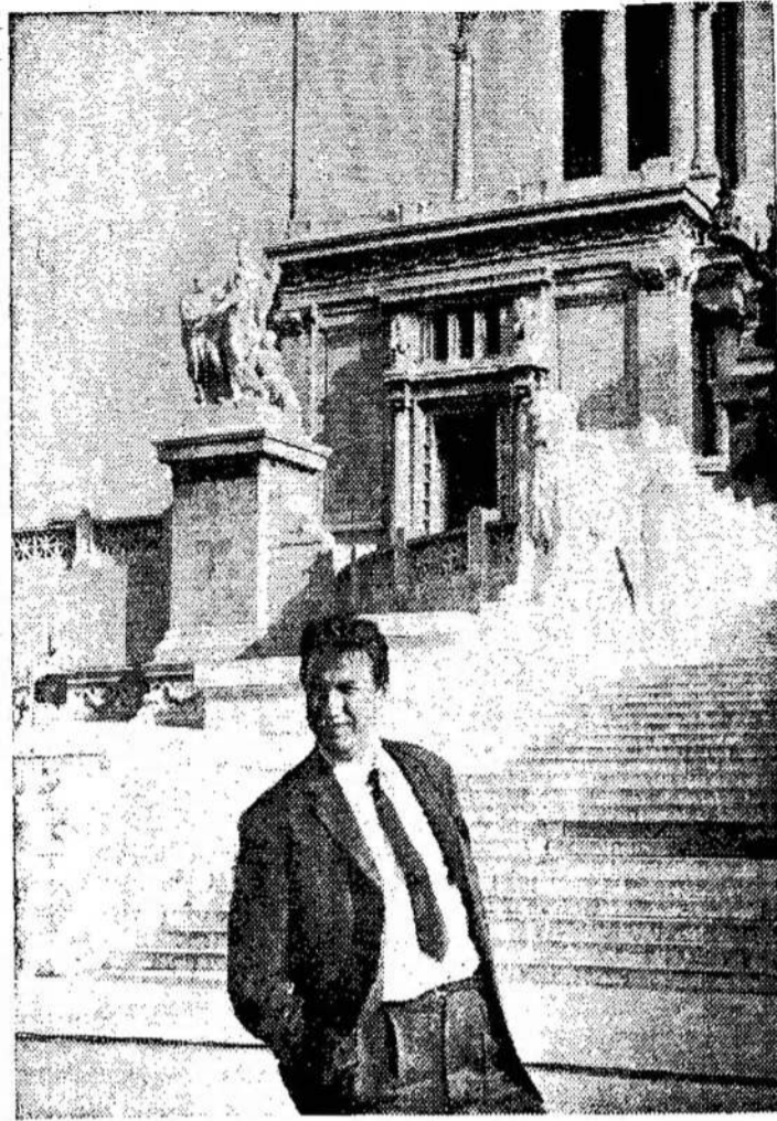
Lietuvos nusipelnęs artistas V. Noreika Italijoje.

Ne vienas buvo tokių, kurie parsidavė šaltojo karo kurstytojams, bet jie visi jau užmirėti.