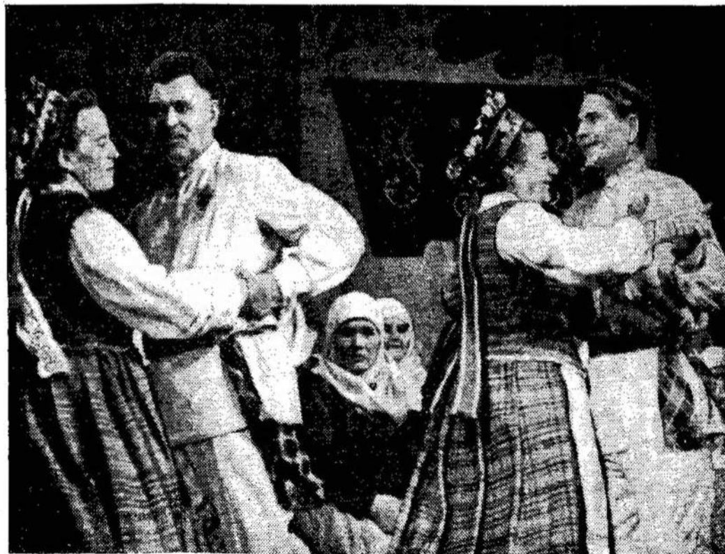
Scena iš "Kupiškėnų vestuvių"

Liaudies Balsas, 160 Claremont St., Toronto 3, Ont. Canada.