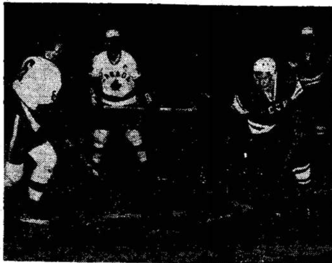
Kanadiečiai galėjo matyti pasaulines hoki (ledo rutulio) žaidynes Vienoje, Austrijoje, ant televizijos. CBC perdavė per visą Kanadą. Kanadiečiai neteko pirmos vietos hoki pasaulyje.

Montrealo policija darė kratas visose laikraščiu ir knygų parduotuvėse ir radusi nudistų spaudos ir kitokių jaunimą tvirkinančių leidinių juos konfiskavo.