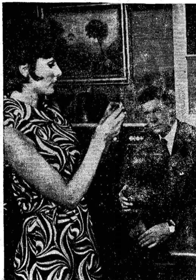
Sue Lloyd ir Steve Forrest, televizijos serijinio pastatymo "The Baron" žvaigždės.

Namų taksavimas gali priversti prie to, kad žmonės turės bėgti iš savo namų. Ir dabar bėgtų, bet nėra kur bėgti su mažais vaikais.