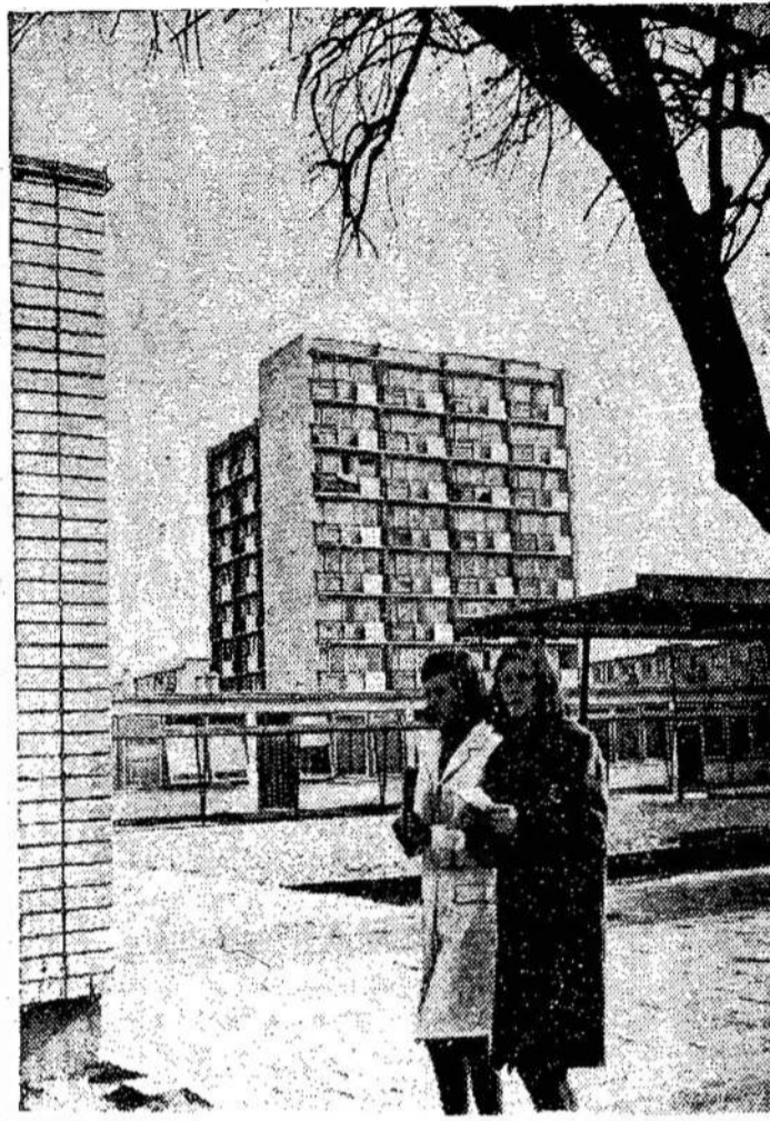
Devyniaaukštis namas Panevėžyje

Įvedus tvarką, kad visi turėtų gauti pilietybę kaip ir ateiviai, ministras galėtų atsakyti duoti pilietybę, jei nepatiks. Tai būtų rimtas ginklas prieš tuos, kurie priklauso įvairiems judėjimams. Pavyzdžiui, galėtų atsakyti pilietybę žmonėms, kurie aktyviai veikia prieš Vietnamo karą, prieš fašizmą.