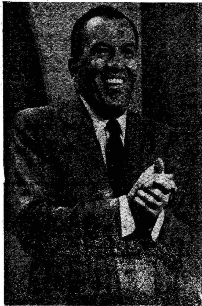
Tai geriausiai žinomas televizijos programos vedėjas Ed Sullivan.

Ateinančiais metais, kurie prasidės nuo gegužės 1 dienos, Montrealo miestas turės išlaidų $25,000,000. Už tad miesto valdyba nutarė pakelti taksus 25 procentais ant nuosavybių, kurios vertos $100,000 ir daugiau.