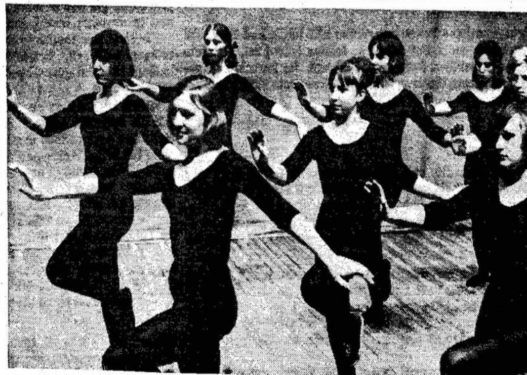
Vilniaus statybininkų kultūros rūmų šokėjos

Liaudies Balsas, 160 Claremont St., Toronto 3, Ont. Canada.