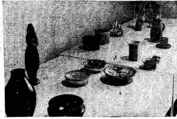
Tarybų Lietuvos jaunųjų keramikų darbai

ATENAI. — Kaip yra sprendžiama iš militarinių lyderių išsireiškimų, tai Graikijoje parlamento jau nebus.