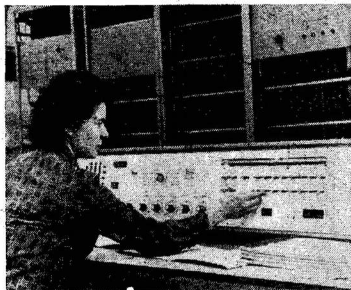
Vilniaus skaičiavimo mašinų gamykloje