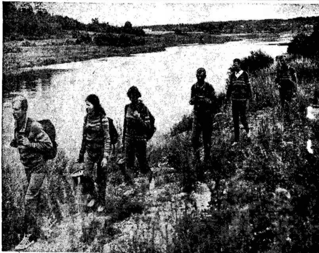
Grigiškių popieriaus fabriko darbininkai laisvalaikį praleidžia turistiniame žygyje.

Vėžio ligos būdų ir vaisių išgydyti, stogvulėlių orti... tą ligą tuvoje žinon tuvos Aido" gustino Gric sėjusl moks Griciūtė sėk viliams nau suprasti, iš tuo pačiu išgydyti.