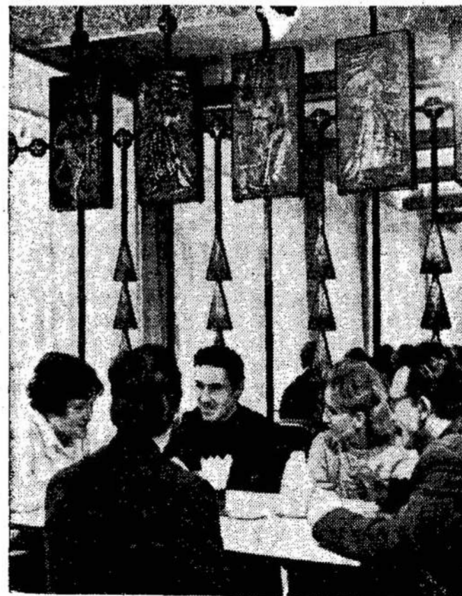
Kauno "Šatrijos" kavinėje - valgykloje.

Užsakymus siųskite su Money orderiais adresu: kaip gegužio mėnesį, o metinės ne vėliau spalio mėnesį. Liaudies Balsas, 160 Claremont St., Toronto 3, Ont. Canada.