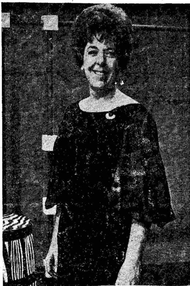
Marg Osburne, televizijos programos „Don Messer's Jubilee“ žvaigždė. Ji, daug laiko pašvenčianti dainai, turi šeimą namie, kuria tenka rūpintis.