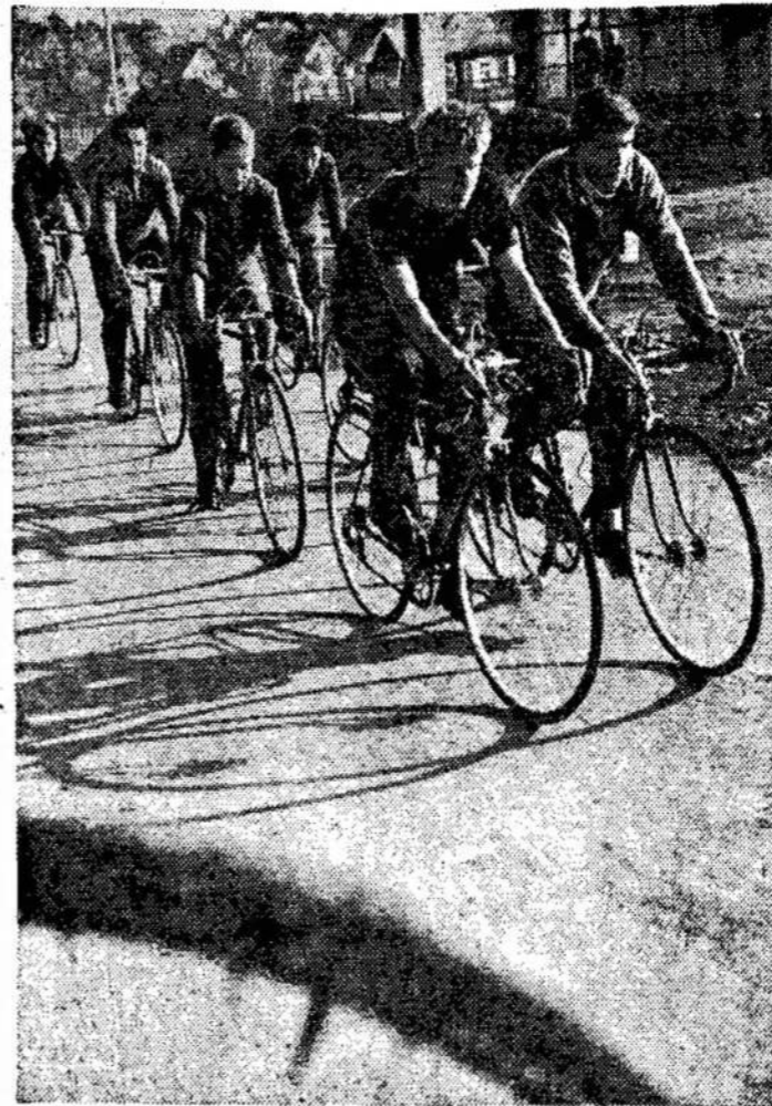
Grigiškių popieriaus fabriko darbininkai laisvalaikiu.

Laikas sugriauš visus kardelių "teorijas" apie okupaciją.