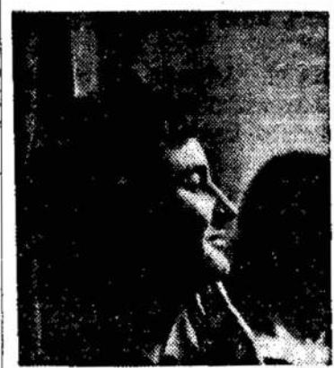
Gabi jauna Lietuvos poetė Judita Vaičiūnaitė.