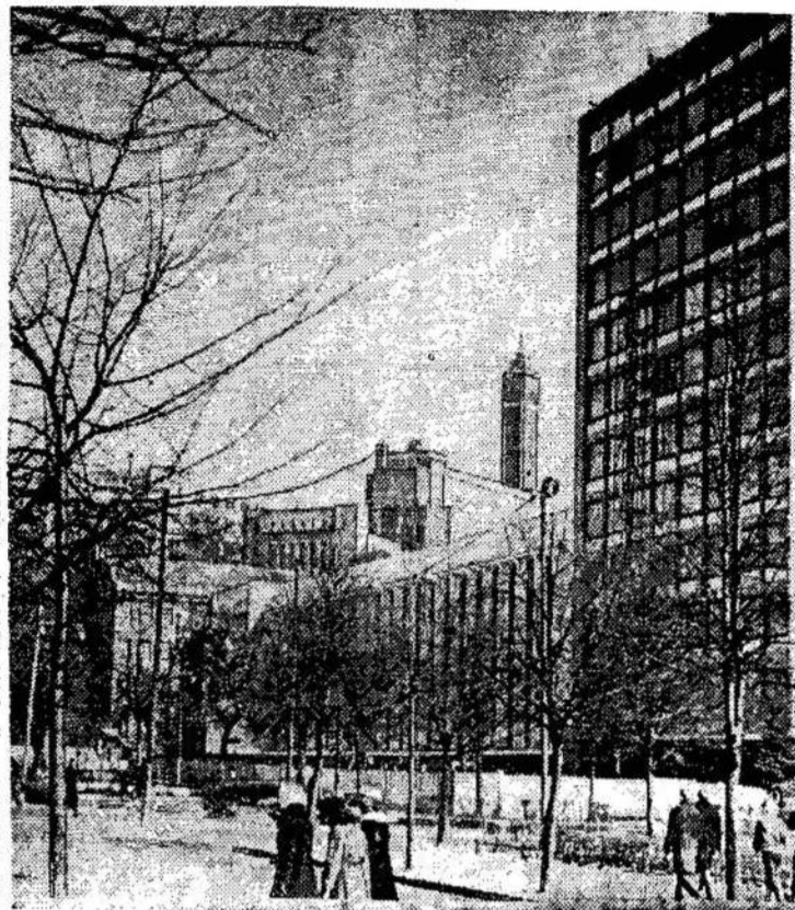
Kaunas — didelių statybų miestas