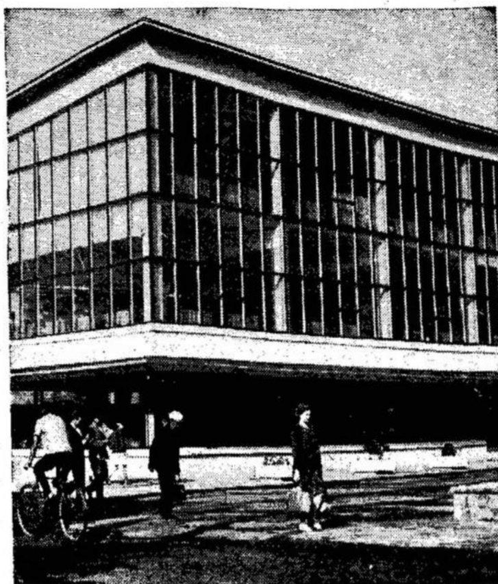
Vilkaviškio universalinė parduotuvė