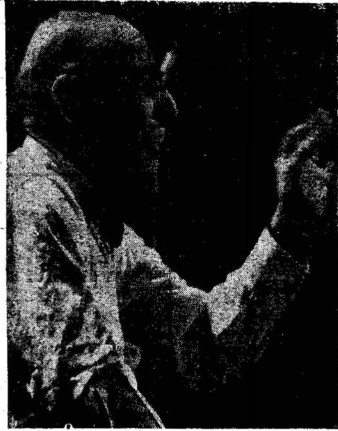
Pasauliniai išgarsėjęs kompozitorius Igor Stravinskis, kuris minėjo savo 85 sukaktuvės.

Visa tai padarė viena partizanų mortiros granata, paleista iš tolo. Ji pataikė į žibalo tanką ir uždegė. Po to sekė visa kita.