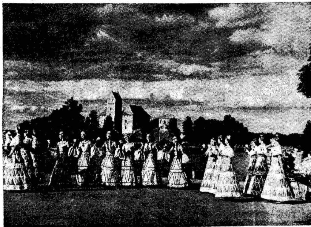
Nusipelnes liaudies dainų ir šokių ansamblis Lietuva.