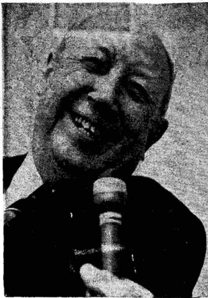
Gordon Sinclair, žurnalistas ir kontroversinis broksteris, kurs duos savo "portretą" programoj, kuri bus perduota per televiziją ketvirtadienį, kovo 7. Jis dažnai sukelia datatkų tarpe triukšmą viešai pareikšdamas, kad jis netiki į jokią dievą.

mos jam jų pačių parašytą Musolinio dienyne.