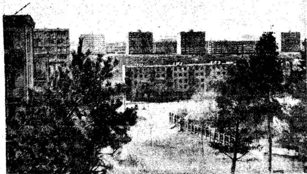
Naujas Vilniaus rajonas.

Reikalaukit mūsų veltul duodamo katalogo.