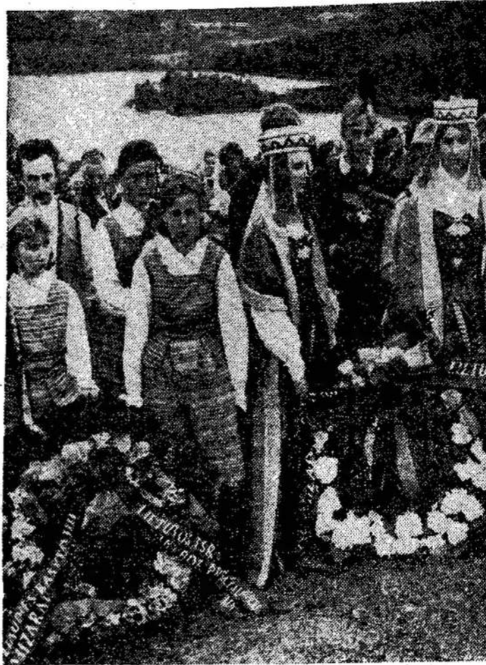
Gelės ir vainikai mylimam tėvynainiui.

Mums, žinoma, nesvarbu, ką jie rašo. Geriau, kad jie rašytų apie save. Apie kitus jie juk negali objektyviai parašyti.