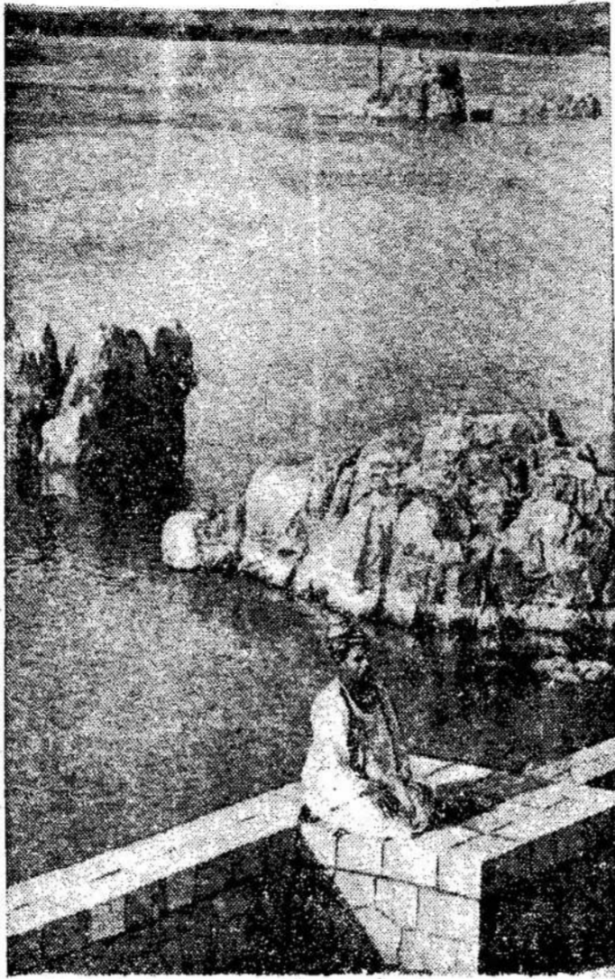
Jungtinė Arabų Respublika. Musulmonas, saulei leidžiantis, meldžiasi prie Nilo kranto.

O su Martino Kingo žudiku visai kas kita.