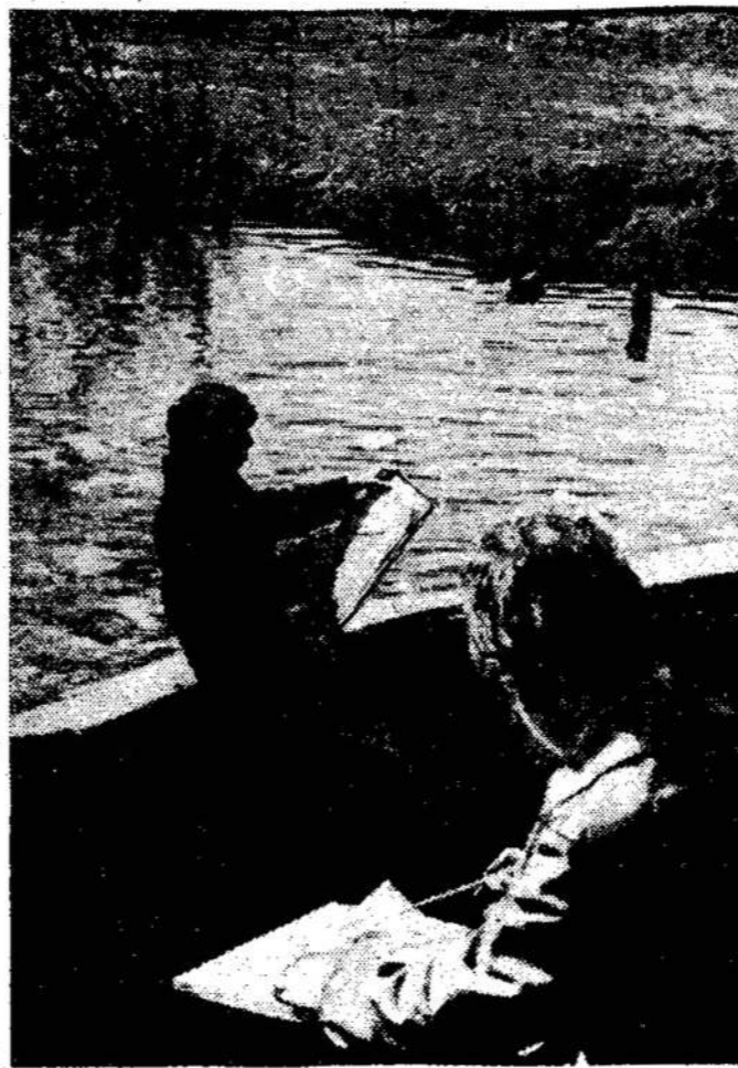
Nuotraukoje: Šiaulių vaikų dailės mokyklos moksleiviai užsiėmimų metu.

Vandenių paukščių (ančių, žąsų) kiaušinių betarpiškai vartoti negalima. Juos galima