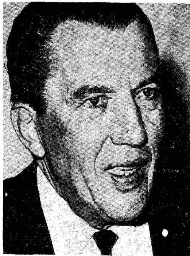
Apie Ed Sullivan nereikia aiškinti. Ši televizijos žmogų visi gerai žinot. Jo programa perduodama ir Kanadoje per CBC TV.

Gal būt, jie tuos pusanatro milijono parašų turi taip, kaip mūsų "vaduotojai" Amerikoje milijoną lietuvių, savo paskėjų.