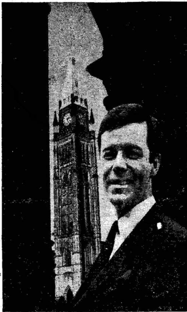
Gordon Pinsent, Kanados televizijos programos apie Kanados politiką, aktorius. Jis vaizduoja parlamento narį.