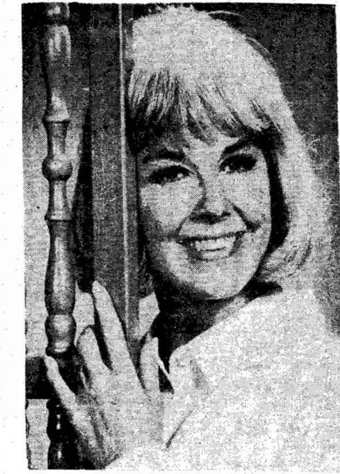
Žymioji Hollywoodo aktorė Doris Day, kuri dabar vaidina ant televizijos jauną našlę, kurios vyras žuvs Vietnamu. Doris Day Show matomas pirmadienių vakarais.

bet kur gauti tuos pinigus? Nemalonu, bet kitos išeities nėra.