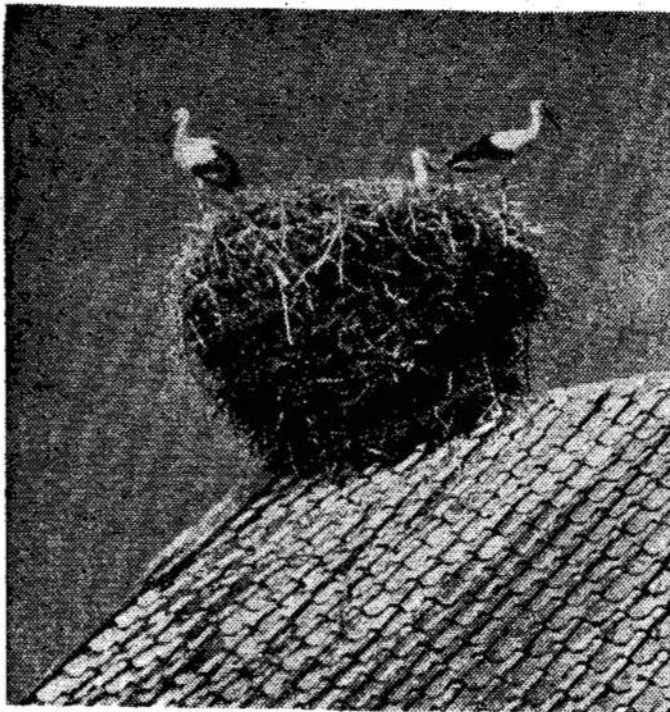
Gandrų šeiminėlė — būdingas Nemuno deltos peizažo puošalys.

Fašistiniai ir militaristiniai režimai yra ženklas, kad senoji santvarka eina prie savo galo.